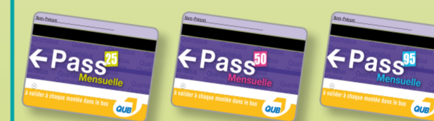
Il existe 3 cartes différentes selon le niveau de réduction.